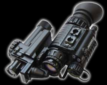
ClipIR® Wärmebildgebungsgerät zum Anklebmen, mit integrierter Halterung an Thermoteknix NiCAM™-14 NVG montiert