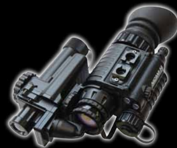
Imageur thermique ClipIR® à clipser monté sur un NiCAM™-14 NVG Thermoteknix au moyen d'un support intégré.